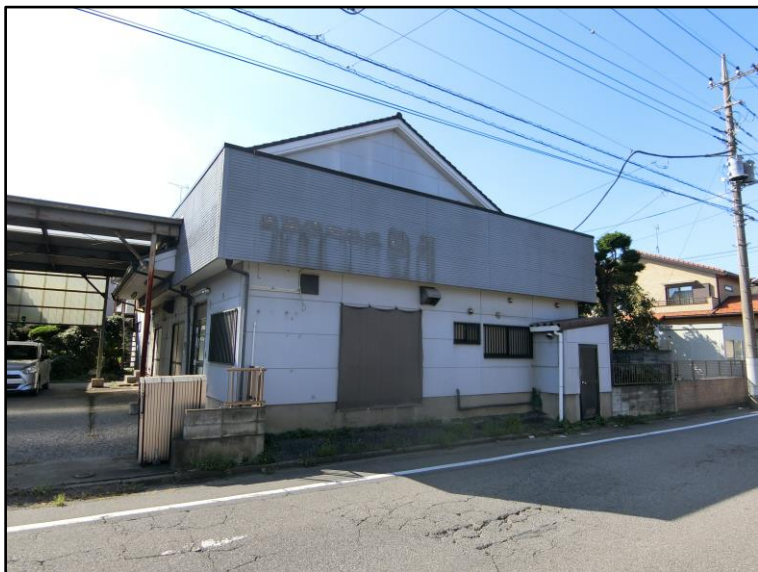
※現況：古家有。売主負担にて建物解体、更地渡し。 ※敷地内の既存ブロックは売主にて解体予定。